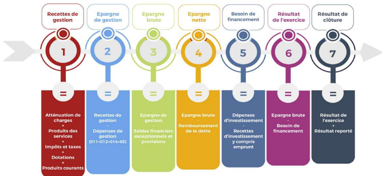
Schéma des soldes intermédiaires de gestion